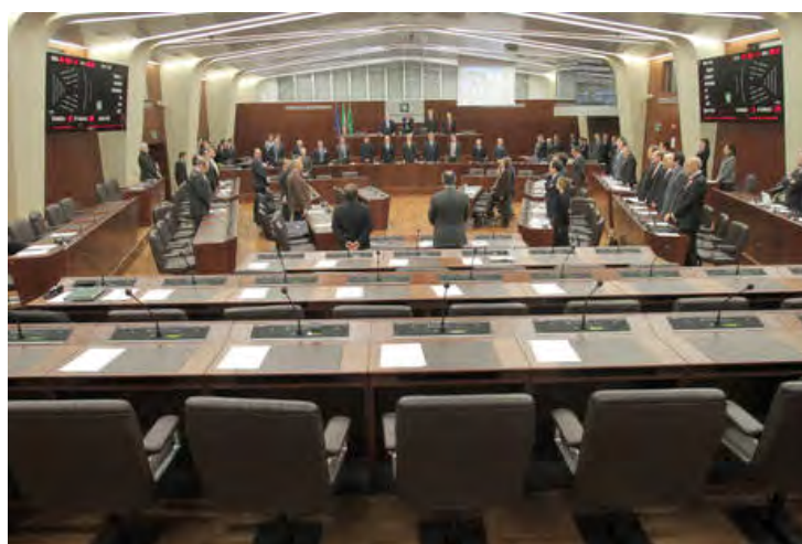
L'aula del consiglio regionale della Lombardia con i banchi lasciati vuoti dai consiglieri leghisti