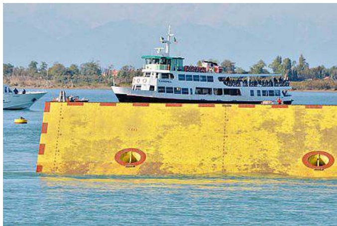
Una paratoia del Mose, il sistema che dovrà difendere Venezia

Galan ha patteggiato due anni e dieci mesi (oltre ai due milioni e 600 mila euro da pagare), naturalmente senza la sospensione condizionale, visto che la pena supera i due anni: a