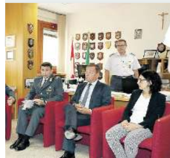
PORDENONE La conferenza stampa degli investigatori e, sopra, la promozione su Facebook di Venice Investment Group

Ci sono anche diversi imprenditori, persone facoltose e sportivi conosciuti a livello nazionale. C'è chi ha messo nelle mani del Venice Investment Group qualche migliaio di euro, chi addirittura mezzo milione. Ma non è assurdo ipotizzare che la cifra esatta di questa maxi truffa non si saprà mai con certezza, perché per qualcuno l'offerta di Gaiatto e dei suoi presunti complici potrebbe aver rappresentato il veicolo ideale per "ripulire" soldi in nero.