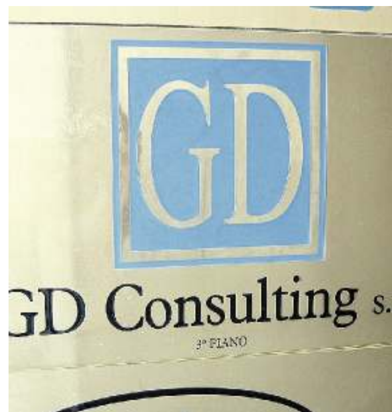
TRA LE DOLOMITI L'ex sede della Gd Consulting a Belluno

che rende molto e con cui si rischia relativamente poco. E chi ci casca si sente come un pollo. Perché ha creduto ai prospetti che gli sono stati mostrati e ha consegnato il denaro con faciloneria. Ma in genere dopo una prima rata incassata, non ha più visto il becco di un quattrino. E pensare