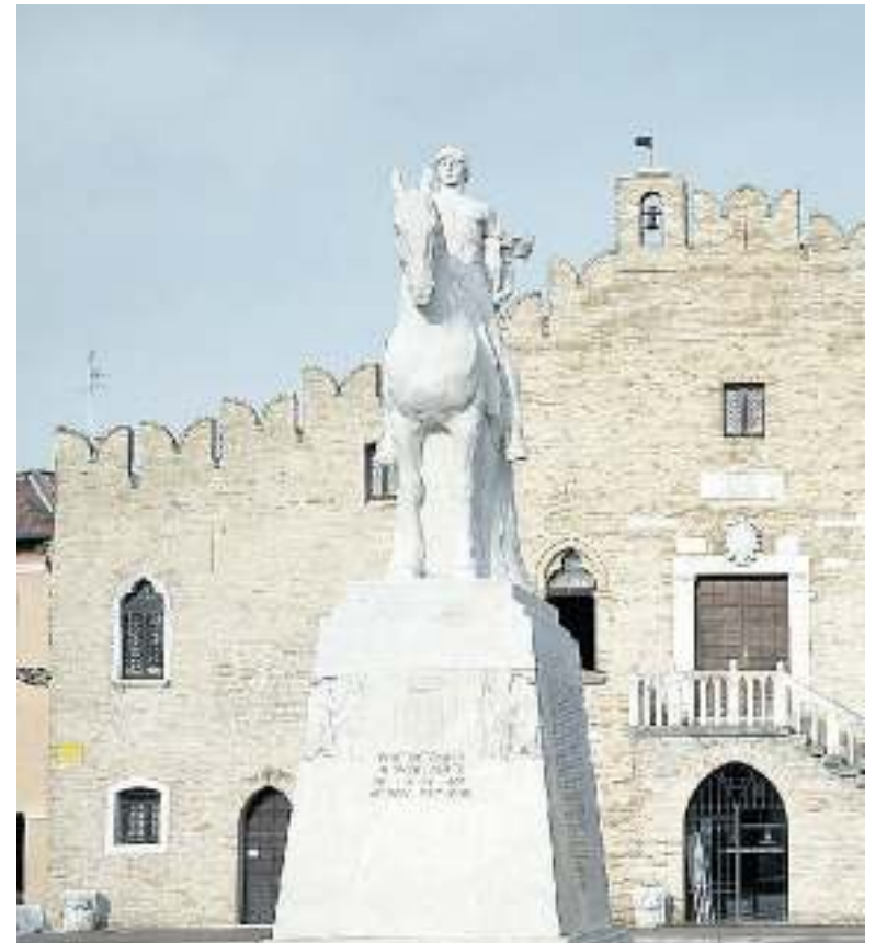
MUNICIPIO Una veduta di piazza della Repubblica

mia persona alle prossime amministrative. La mia decisione è dovuta non solo alla mancanza di sintonia e fiducia con gli attivisti locali, ma soprattutto a divergenze di opinioni insorte negli ultimi mesi. Questa carenza di presupposti ha fatto nascere in me la consapevolezza che non ci sono le condizioni necessarie per poter agire nel territorio con i principi che ho sempre coltivato e perseguito». Tra i big assenti c'è anche il