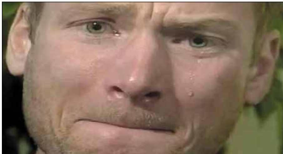
IN LACRIME Il marciatore Alex Schwazer durante l'intervista andata in onda ieri sul Tg1