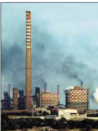
SOTTO ACCUSA L'Ilva di Taranto