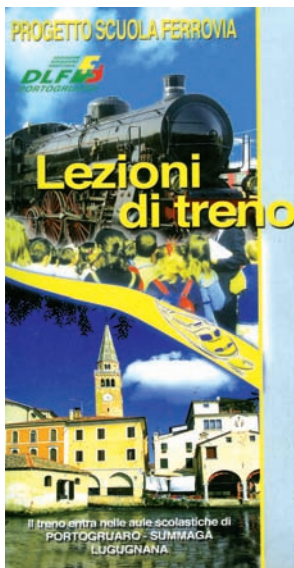
Frontespizio edizione 2008

Avere al nostro fianco Regione del Veneto, Provincia di Venezia e Comuni di Portogruaro e di Concordia Sagittaria ci farà lavorare meglio per i nostri ragazzi/studenti e costituisce anche un riconoscimento al valore della nostra attività istituzionale, alla professionalità dei ferrovieri ed ex dipendenti delle F.S. che con grande spirito di servizio partecipano alla realizzazione del progetto. I ragazzi si confronteranno con notizie storiche, con ri-