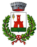
Comune di Fossalta di Portogruaro