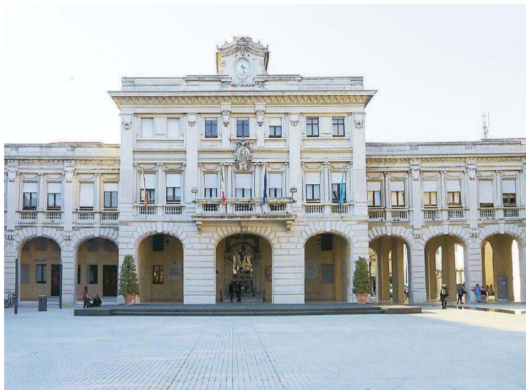
Una veduta del municipio di San Donà in piazza Indipendenza