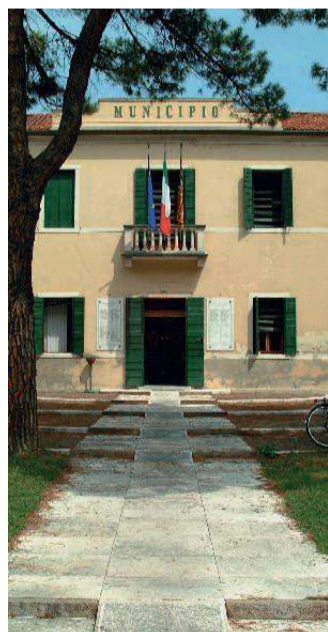
Il municipio di Martellago