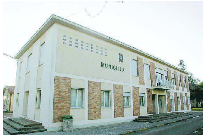
Una veduta del municipio di Pianiga