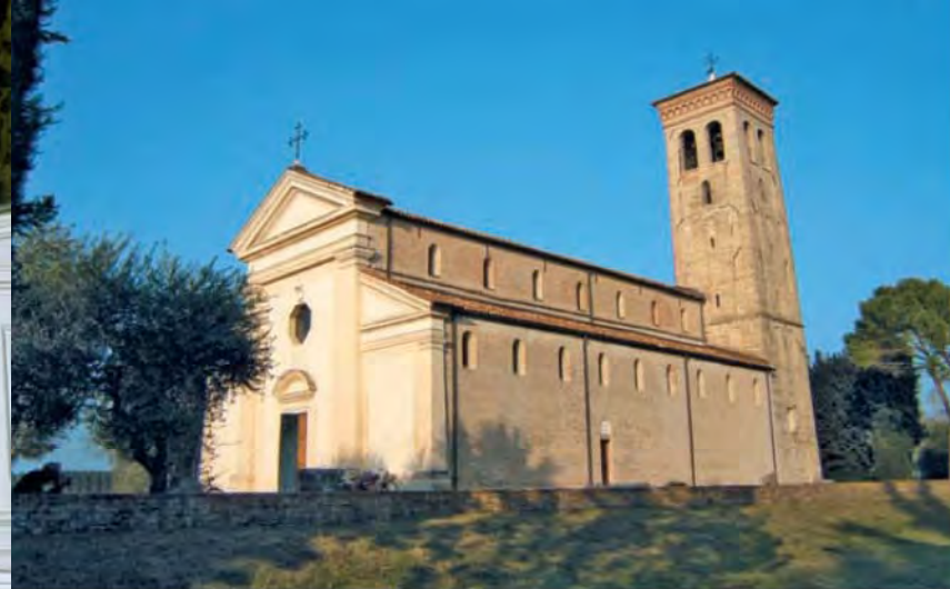
Summaga, chiesa abbaziale.

stia), e l'opera più interessante, un Compianto su Cristo morto , terracotta policroma di anonimo scultore di area padovana (fine sec. XV-inizio sec. XVI).