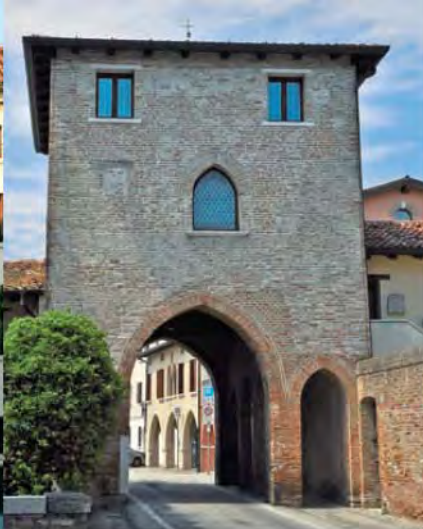
Porta S. Agnese.