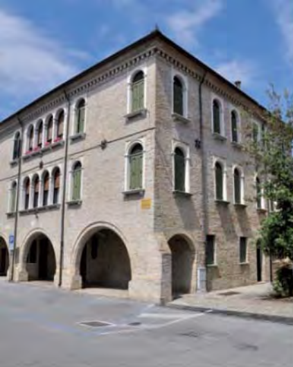
Palazzo già Travaglini-Marostica.