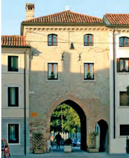
Porta S. Gottardo.