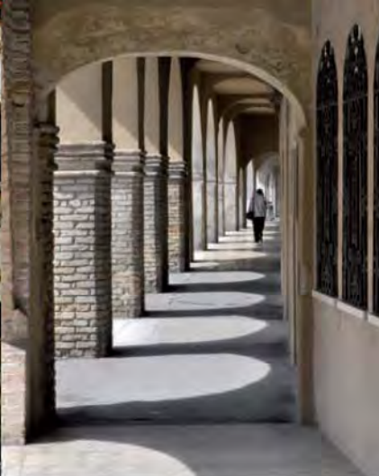
Via Cavour, portici.