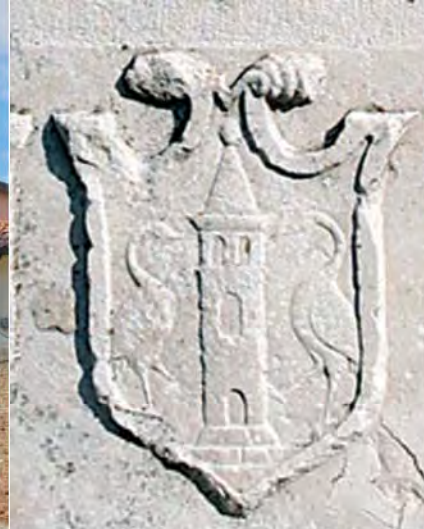
Ponte S. Gottardo, stemma cittadino del 1523.