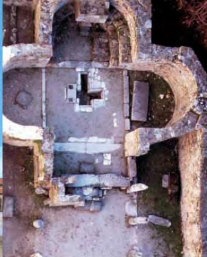
Concordia Sagittaria, trichora martyrion.

dici Apostoli, raffigurati frontalmente entro finti intercolumni. Nel registro inferiore la raffigurazione della parabola evangelica delle vergine sagge e delle vergine stolte . Altri affreschi (pilastri) risalgono al sec. XIV, mentre ai secc. XV e XVI vanno riferiti gli affreschi della parete sinistra con alcuni santi (Isidoro, Floriano, Lucia, Benedetto, Urbano). Un recentissimo restauro (2011) ha valorizzato l'absidiola di sinistra dedicata a S. Giovanni del sec. XIII.