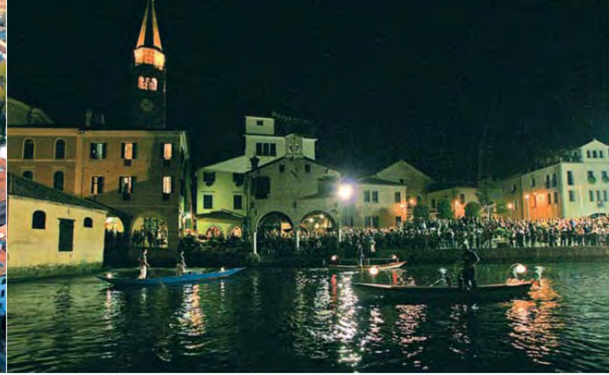
Pescheria, festeggiamenti del 15 agosto.