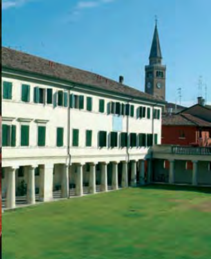
Collegio Marconi, cortile interno.