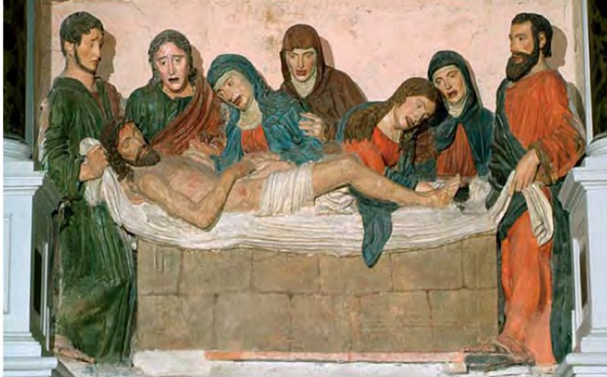
Chiesa di S. Agnese, compianto sul Cristo morto.