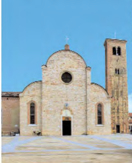
Concordia Sagittaria, cattedrale.