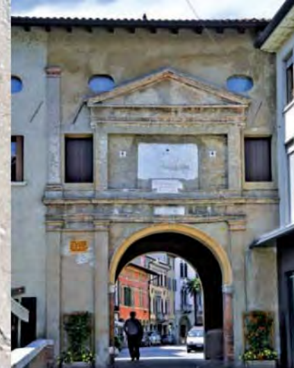
Porta S. Giovanni.

co nato nel 1835, e che organizza tra agosto e settembre il Festival Internazionale di musica, giunto nel 2012 alla 30ª edizione.