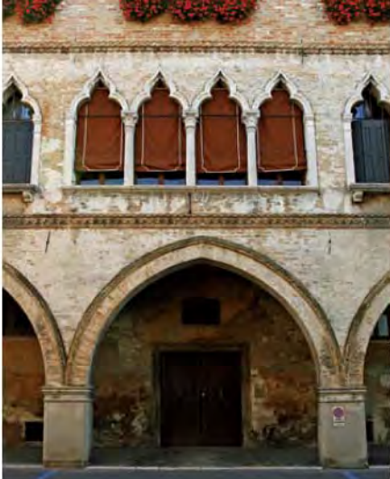
Via Martiri della Libertà, Palazzo de Götzen.