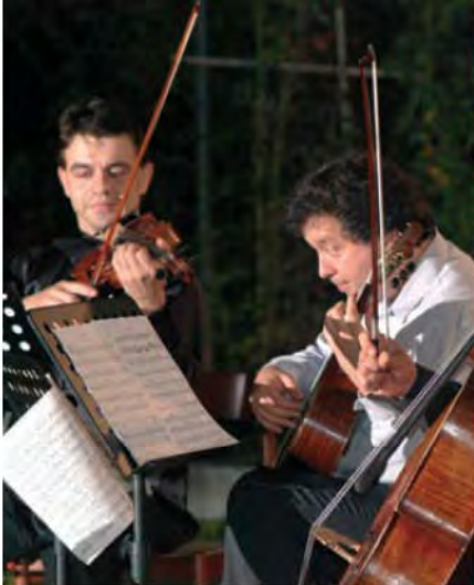
Festival Internazionale di Musica.