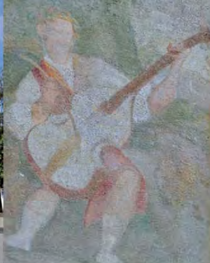
Palazzo Marzotto, affreschi della facciata, particolare.

XIV, affrescato nel '600 da Giulio Quaglio (restano tracce). Dal 1877 sede di Uffici pubblici. Sulla facciata due lapidi ricordano Luigi Russo (1885-1947), e Girolamo Venanzio (1791-1872).