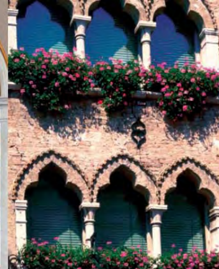
Via Martiri della Libertà, Palazzetto Moro.

contemporanea. A nord dei mulini il cinquecentesco ponte di S. Andrea, sul cui pilone frangiflutti il FAI ha ricollocato nel 2010 un leone marciano, in sostituzione di quello abbattuto dai francesi nel 1797.