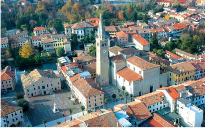
Veduta aerea del centro storico.