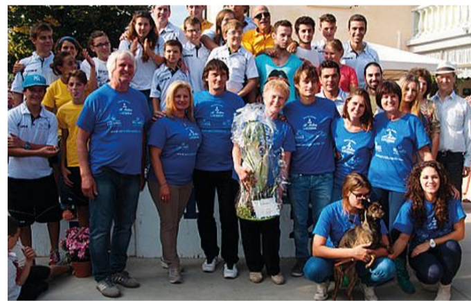
Il gruppo del Canoa Club Oriago