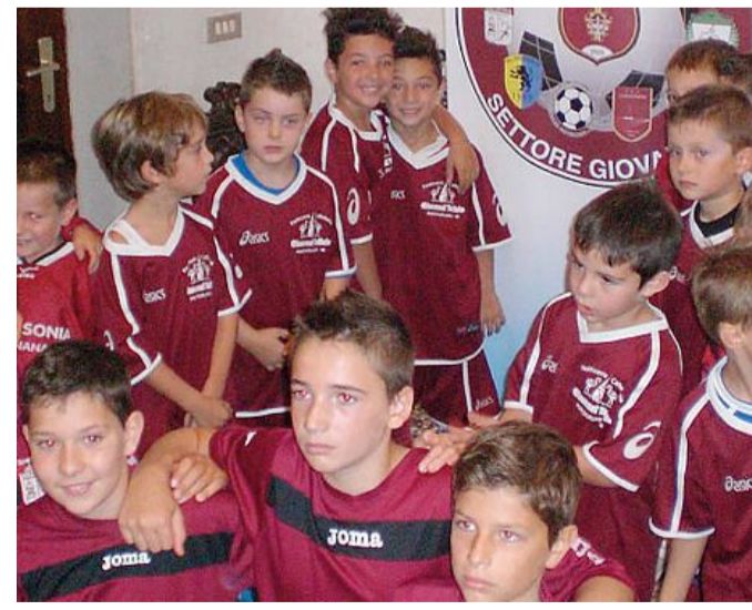
Una festa anche per i più piccoli, mentre il settore giovanile si allarga