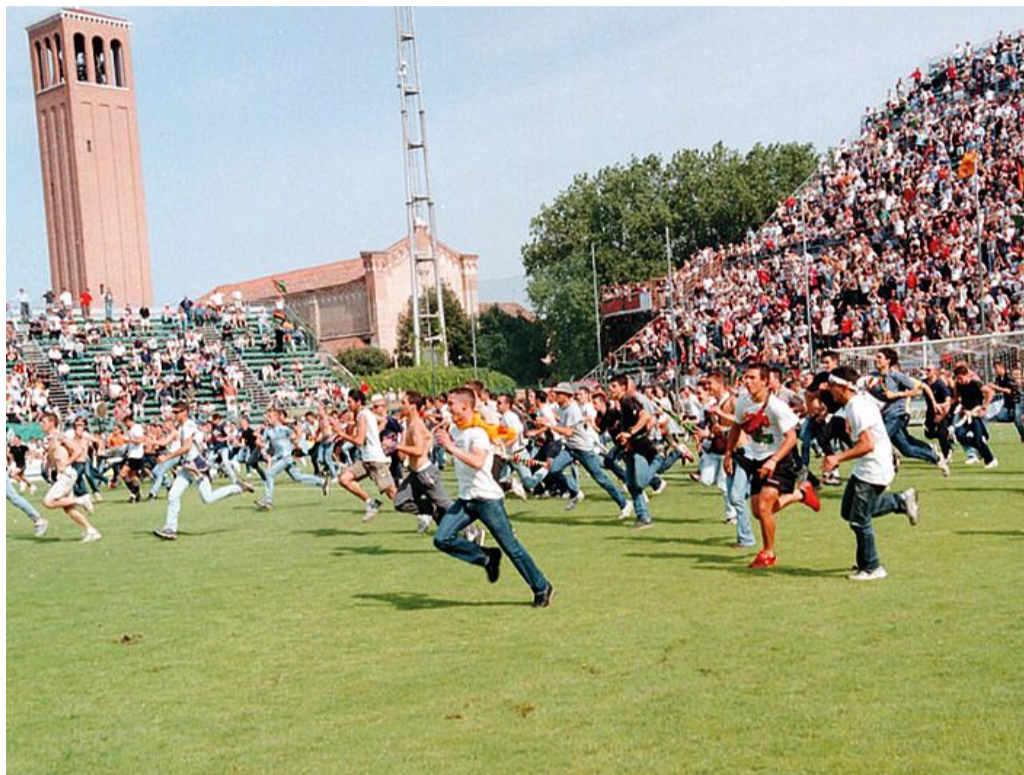
Pacifica invasione di campo: uno dei tanti momenti di entusiasmo dei tifosi nella storia centenaria del Penzo

Abbonamenti. Venerdì si è chiusa la campagna abbonamenti