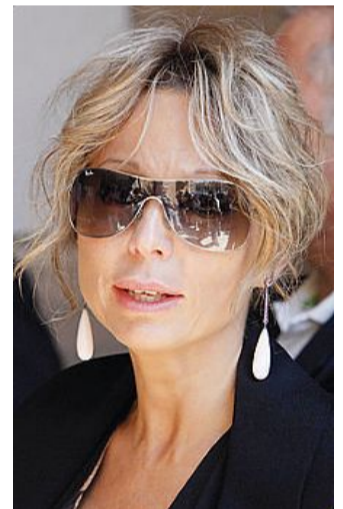
Marina e Piersilvio Berlusconi ieri con il padre a Palazzo Grazioli

1994, quando Berlusconi, mentre presiedeva da capo del governo una Conferenza mondiale delle Nazioni Unite, ricevette un invito a comparire dalla procura di Milano, che stava indagando su presunte tangenti alla Guardia di Finanza. Da quel momento seguirono una valanga di inchieste e processi nel capoluogo lombardo: dai casi All Iberian e Mills, fino all'affaire Lodo Mondadori, dai procedimenti Mediaset e Mediabase fino alle indagini sulle serate di Arcore e sulla fuga di notizie dell'intercettazione Fassino-Consorte nel caso Unipol/Bnl. Berlusconi ha sempre respinto le accuse al mittente, combattendo una battaglia personale contro quelle toghe, a suo dire, politicizzate, «un cancro della democrazia».