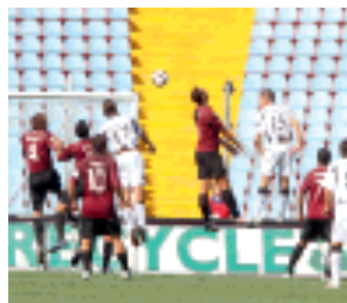
L'AZIONE. Un'incursione sotto porta

Primavera. La squadra del Porto ha perso 3-0 a Terno d'Isola, contro l'Albinoleffe, nella 3ª giornata di campionato. In partita per oltre un'ora, i