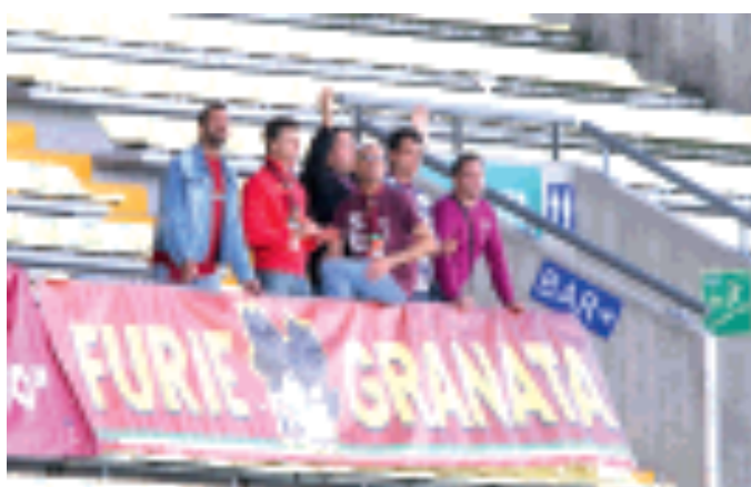
I TIFOSI. I fedelissimi del Porto sabato allo stadio Friuli di Udine