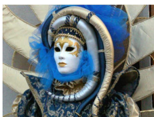
MASCHERA DI CARNEVALE