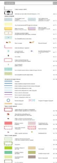
PAT - CARTA DEI VINCOLI - scala 1:10.000