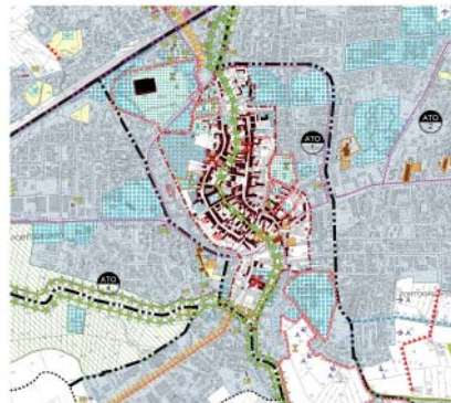
PAT - CARTA DELLA TRASFORMABILITÀ - scala 1:10.000