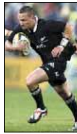
REGISTA Il neozelandese Aaron Cruden

□ UNDER TRAVOLTA - A Dublino l'Italia sperimentale Under 20 è stata travolta 43-10 dai pari età dell'Accademia del Leinster.