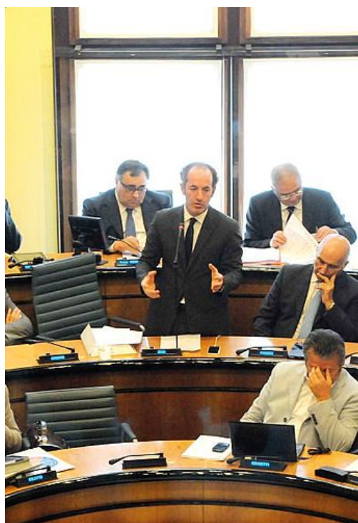
Un'immagine del Consiglio regionale