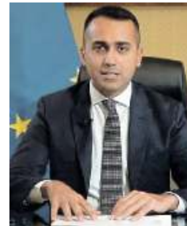
Luigi Di Maio

L'EX PARLAMENTARE SI SCAGLIA CONTRO TUTTI I RIFERIMENTI ROSSO-GIALLI, DA FRANCESCHINI ALLA UE, ALLA LAGARDE