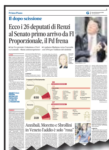
La pagina di ieri del Gazzettino che dava conto dei "movimenti" dal PD al nuovo partito di Renzi

Il messaggio del salvare il soldato "Giuseppi" è arrivato forte e chiaro a Palazzo Madama e il luogo dove si sta costruendo il primo paracadute è quel gruppo di centristi Udc di Noi con l'Italia, che è stato finora la quarta gamba del centrodestra. Tre senatori - Antonio De Poli, Paola Binetti, Antonio Saccone - che nei boatos di Palazzo potrebbero diventare all'occorrenza